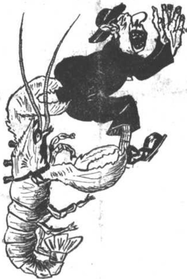
— U! Diabos levem esta vida! Até os bichos já não me podem ver!...

E o curioso é que essas sentenças são proferidas em virtude de uma lei antiga, feita para defender o catholicismo... que já não é a religião official! Agora serve para defender o protestantismo. E o que é demonstrado num livro recente do sr. Bradlaugh Bonner.